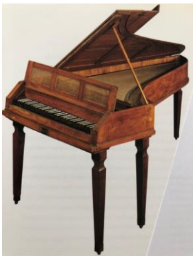
pianoforte van J.A. Stein uit 1782

In 1170 ontwierp Americus Backers te Londen een afgeleide vleugelvormige pianoforte naar de vorm van een Engels klavecimbel. Het had een opmerkelijke hamertechniek, dat later van grote invloed zou zijn voor de ontwikkeling van de vleugelvormige piano's in Europa en een goed alternatief bood voor de populaire tafel piano's van Zumpe.