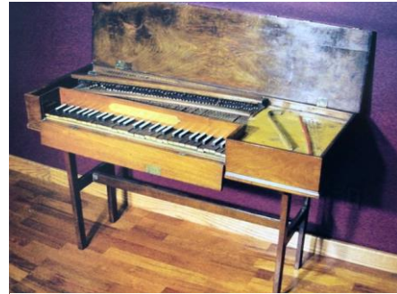
tafel piano uit 1766

Hoewel Cristofori wordt beschouwd als de uitvinder van de voorloper van de hedendaagse piano, zijn er bewijzen dat er in de 15 e eeuw besnaarde klavierinstrumenten bestonden waarbij de snaren werden aangeslagen.