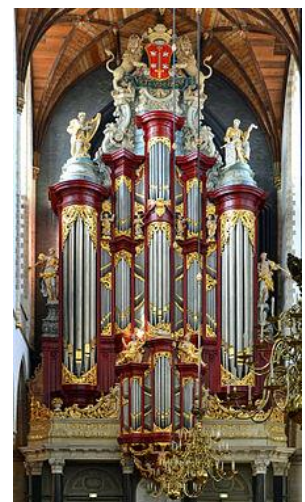
St. Bavo Haarlem

Hij is tevens organist van de Westerkerk in Amsterdam en van de Gotische Zaal te 's-Gravenhage.