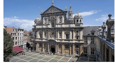
Carolus Borromeus kerk

Op zaterdag 26 augustus jl. vond de 30e orgelexcursie plaats van de MBO. De tocht ging deze keer naar België. Daar werden de Van Peteghem-orgels in Aartselaar en Schelle bezocht. Het orgel van de